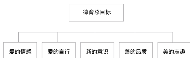
图2 武汉市中小学德育总目标

（1）武汉市中小学德育总目标。将中小培养学生培养成为具有爱的情感、雅的言行、新的意识、善的品质、美的志趣的合格公民。（图2）